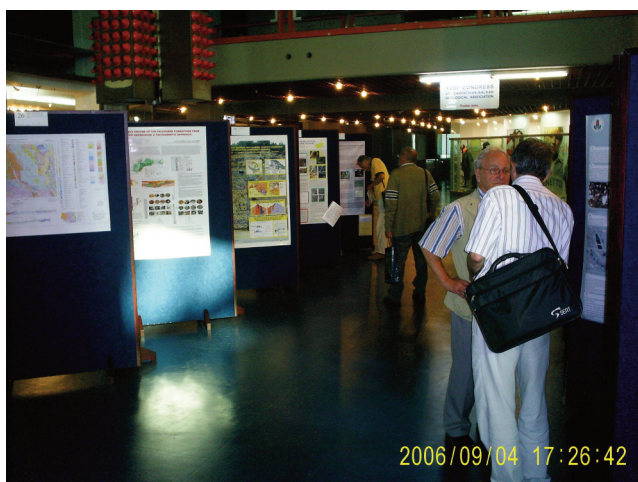
Fig. 5. A poster session during the 18th CBGA Congress (Belgrade, 2006).

democracy, and market economy. CBGA activity up to the next congress was minimized because of many social and political problems of most of the countries of the socialistic block. Although the Federal Republic of Yugoslavia was planning to host the 15 th CBGA Congress, political unrest, economic problems, an international embargo on the country, and substantial geopolitical influence resulted in the cancellation of this meeting (RUNDIĆ et al., 2016). After two years of postponement, Greece, as a new host, organized a meeting for hundreds of participants from the entire CBGA community and other parts of Europe (Athens, 1995). In the following more than two decades, seven congresses have been organized (Vienna, 1998; Bratislava, 2002; Belgrade, 2006; Thessaloniki, 2010; Tirana, 2014; Salzburg, 2018 and Plovdiv, 2022). During the 18 th Congress in Belgrade (2006, Fig. 5), the CBGA Council