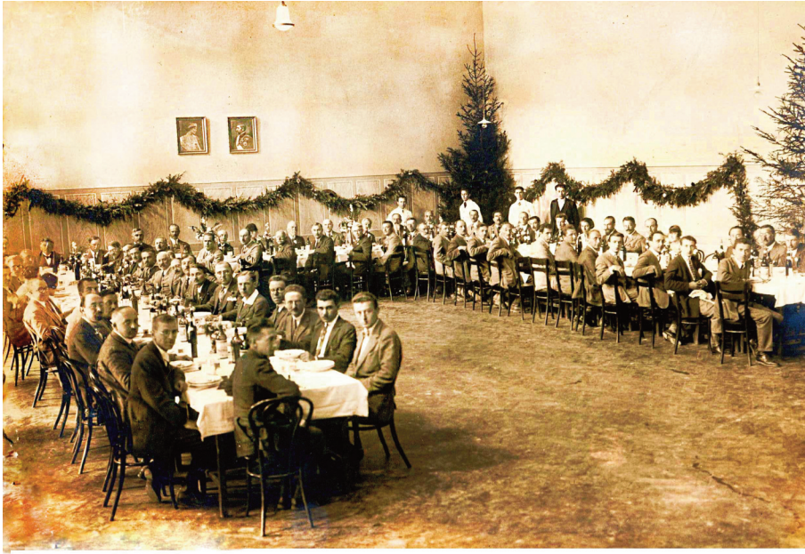
Fig. 3. Participants of the 2nd Congress of CBA in Bucharest, Romania (1927). (RUNDIĆ et al., 2016).