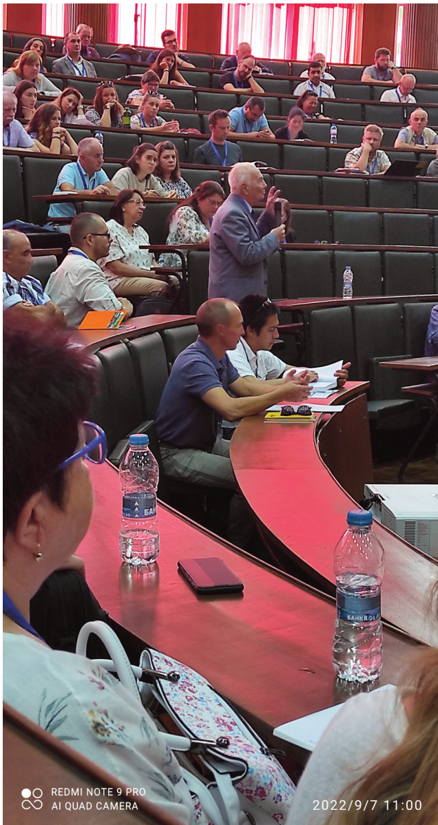
Fig. 6. A detail from the opening ceremony of the 22nd CBGA Congress in Plovdiv, Bulgaria (2022). Academician I. ZAGORCHEV (in the middle) welcomed the participants and guests.

remains the central pillar of the future development of CBGA. Of course, some of the prominent geologists from the CBGA community are slowly leaving the scene. But also, many of them still work, finding a strong motivation in this beautiful science and practice, looking forward, as before, to meetings with colleagues from various countries, exchanging expert opinions, and discussing specific problems.