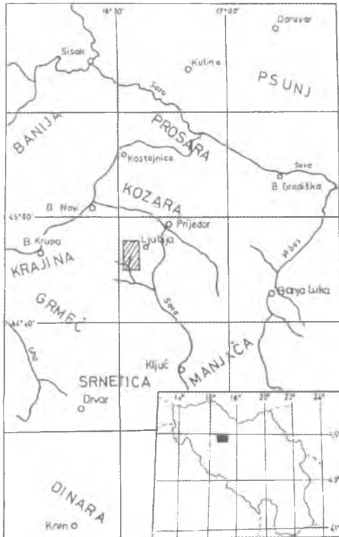
Сл. 1. Географски положај испитиваног терена Fig. 1. Geographical location of the study area.

(сл. 1). Оно обухвата терен који се пружа западно од Љубије и то од Шурковца на северу; преко Горње Равске на западу; Батковића и Старе Ријеке на југу, Атлије, Томића и Централних Љубијских Рудишта на истоку и југоистоку.